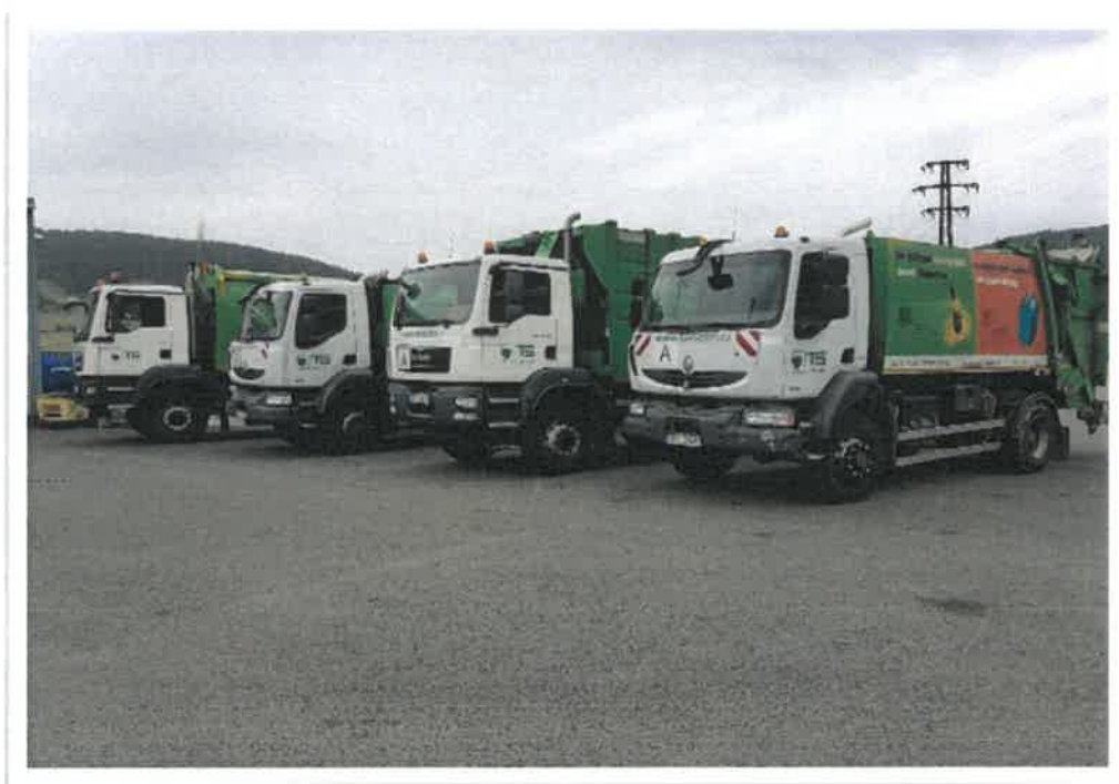
Obr.: Vozidlo první zprava ke generální opravě

Dalším velkým výdajem plánovaným již od roku 2017 je generální oprava lineárního presu na podvozku Renault. Tento náklad sice není z účetního hlediska investicí, ale představuje náklad ve výši 3 mil. Kč. Na financování této opravy společnost tvořila rezervu v letech 2017 a 2018. Celková cena opravy byla 3.002.000,- Kč bez DPH.